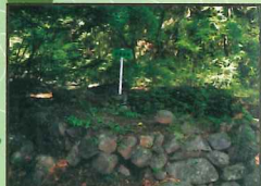
② かつて炭焼に使われた窯跡。