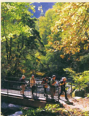
⑥ 休戸橋を渡るハイカー。