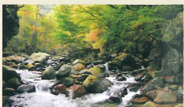
③ 天鼓林から上流を見る。