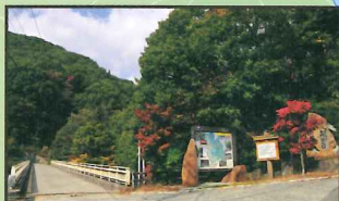
① 渓谷の道は竜門橋から始まる。