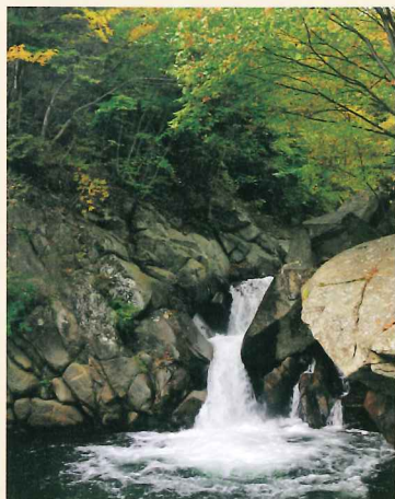
⑨ 清冽な水が注ぐ蜘蛛淵。