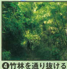
④ 竹林を通り抜ける。