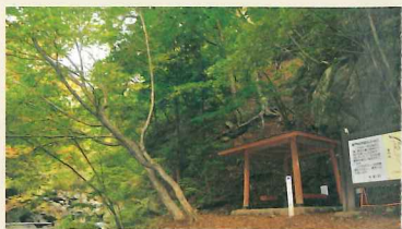
⑤ 渓谷のほとりの休憩舎。

大菩薩連嶺の南麓を流れる日川にあり、花崗岩の巨石と水量豊かな清流で知られる。渓谷に沿って約2kmの遊歩道が整備されており、新緑から紅葉まで、折々の渓谷美を満喫できる。