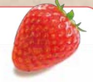
＼ Strawberry /