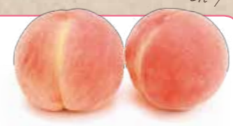
＼ Peach /