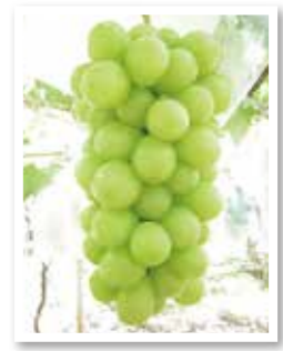
シャインマスカット