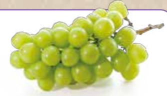
＼ Grape /