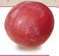
＼ Plum /