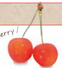
＼ Cherry /